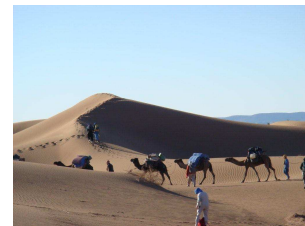
Caravane en marche

Inscription souhaitée avant le 15 février 2018