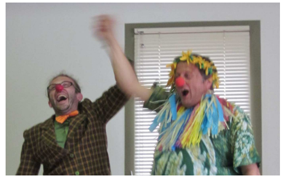
Merci à Richart Maire pour ses dessins